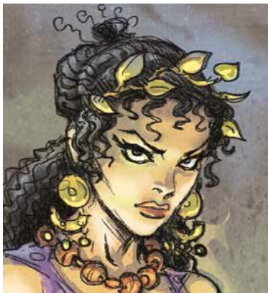
Medea, kona Ægeus kongs, drottning í Athen