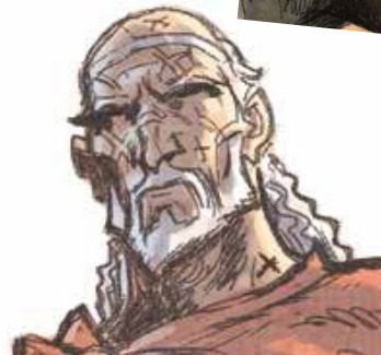
Erebus, ráðgevin hjá Ægeus kongi