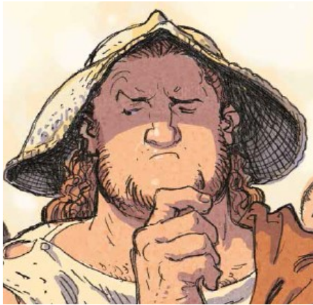
Cadmus, eigur eitt lið av glímarum í Athen