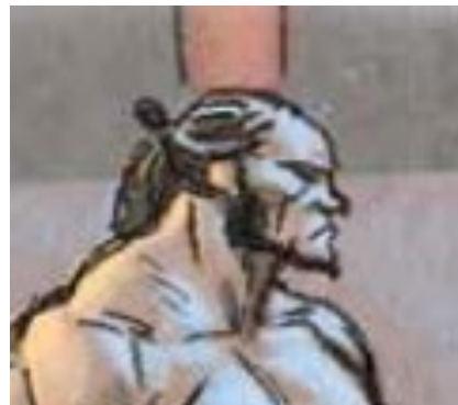
Arion, sonur Medeu og Ægeus kong, hálvbeiggi Teseusar