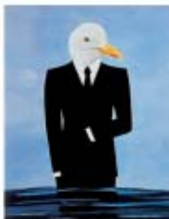
Nordatlantisk: Cosmopolitans 1-4 99x70 cm: Aryl sa canvas